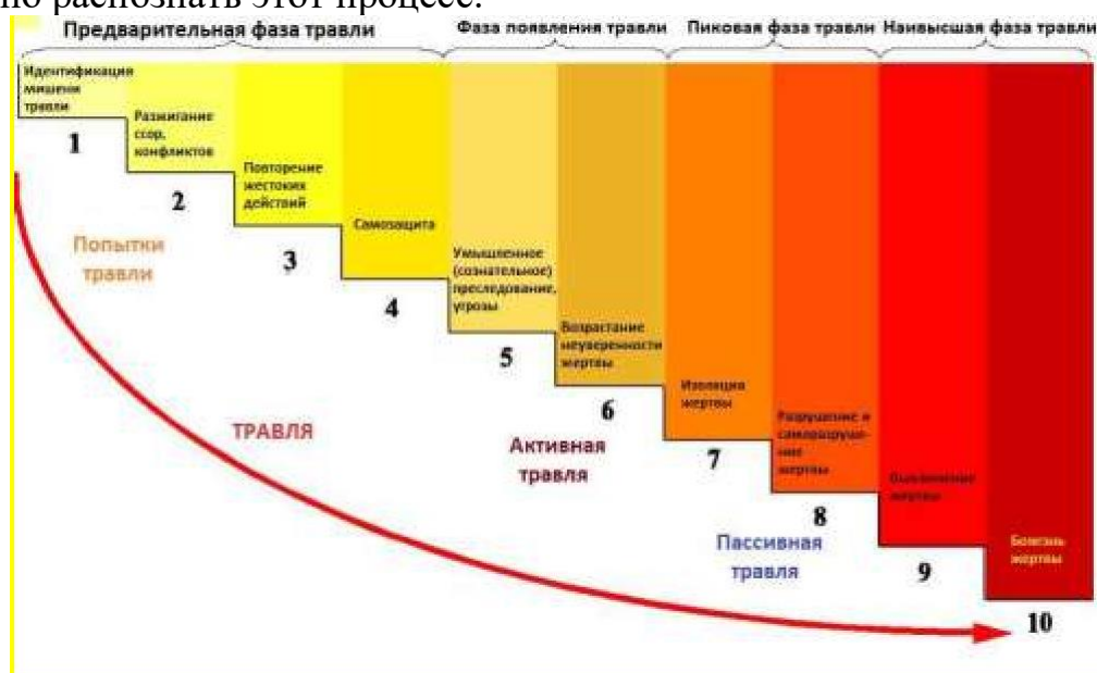
Рис. 3 Фазы буллинга

Буллинг как правило развивается по определенной схеме и имеет несколько фаз развития, которые можно изобразить как «лестницу» (рисунок 3). От момента зарождения до наивысшей фазы. Каждая ступень – это определенный этап развития, он соответствует определенному эмоциональному состоянию пострадавшего и определенным действиям обидчика. Вмешательство и прерывание процесса возможно на любой ступени, поэтому так важно распознать этот процесс.