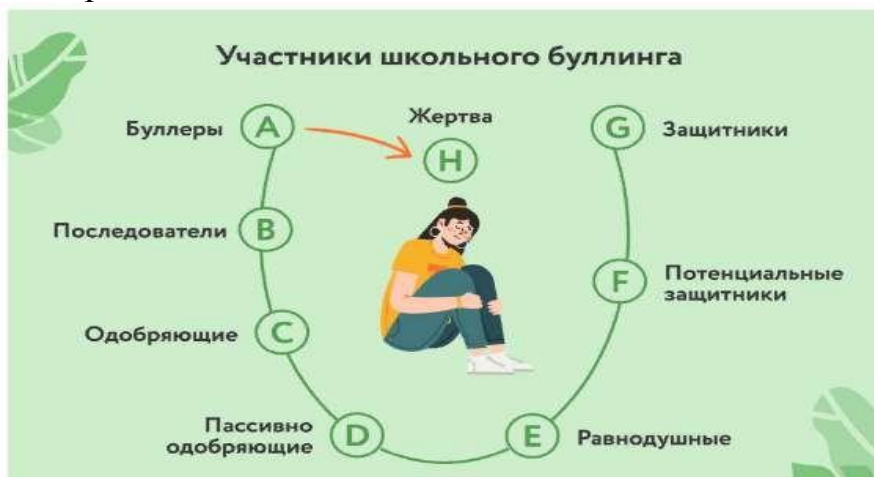
рис. 2. «Схема» буллинга

Итак, какой бы ни была причина данной ситуации, в ней всегда есть несколько «ролей» - рис. 2.